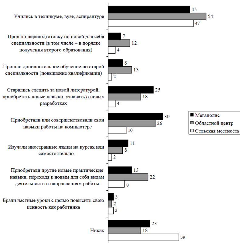
Рис. 3.3 Источники пополнения знаний молодежью в зависимости от места проживания, %

утверждения говорит и частота обращения к образовательным услугам молодежи разных типов поселений (рис. 3.3). Как видно, практически единственной возможностью сельской молодежи набраться знаний является учеба в стенах техникума или вуза. Спектр возможностей горожан значительно шире.