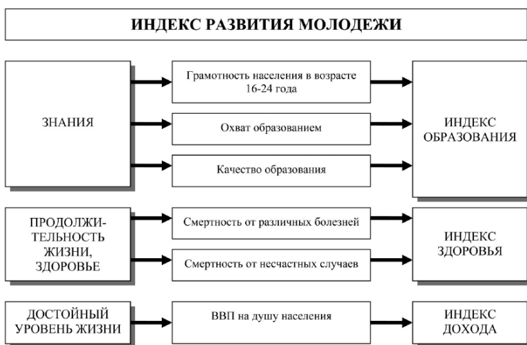
Рис. 3.1. Методология расчета индекса развития молодежи

Индекс дохода, входящий в состав обобщающего показателя индекса развития человеческого потенциала по субъектам Российской Федерации, позволяет комплексно оценить состояние человеческого потенциала молодого поколения.