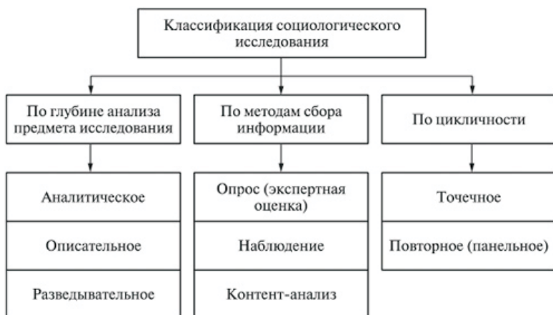
Рис. 2.1. Формы социологического исследования

В целом классификация видов социологического исследования приведена на рис. 2.1.